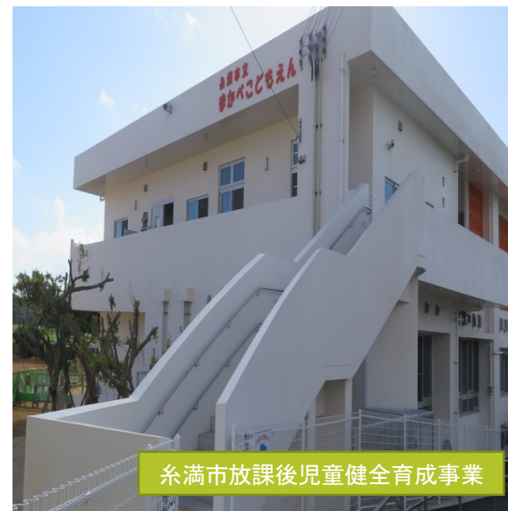
糸満市放課後児童健全育成事業