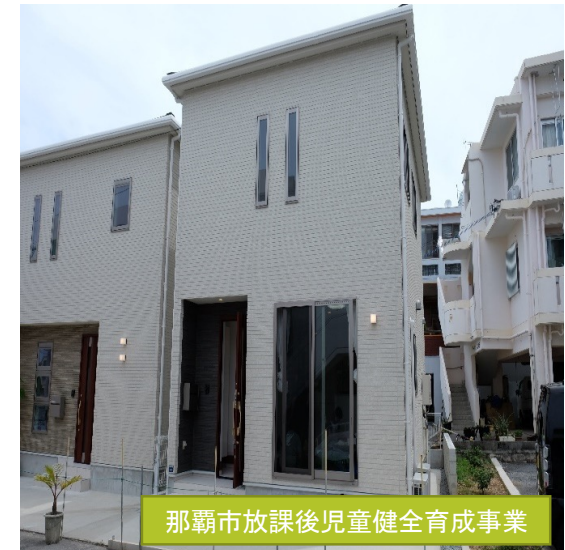
那覇市放課後児童健全育成事業